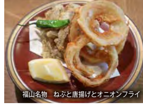
福山名物 ねぶと唐揚げとオニオンフライ