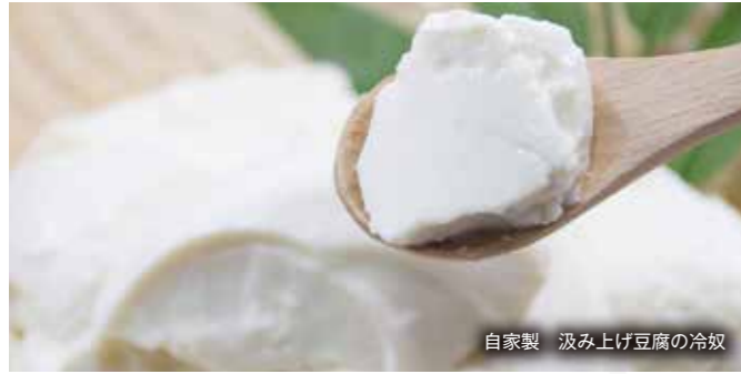
自家製 汲み上げ豆腐の冷奴