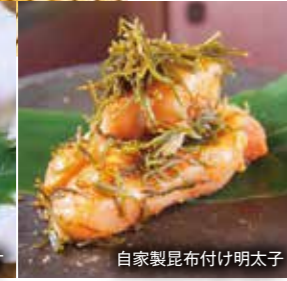
自家製昆布付け明太子