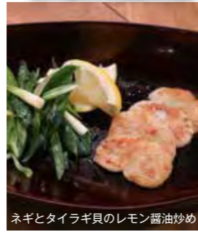
ネギとタイラギ貝のレモン醤油炒め