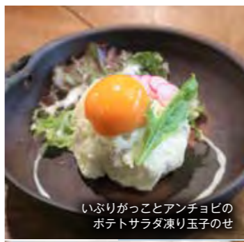
いぶりがっことアンチョビのポテトサラダ凍り玉子のせ