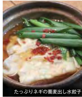
たっぷりネギの蕎麦出し水餃子