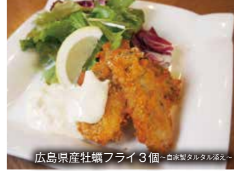
広島県産牡蠣フライ3個~自家製タルタル添え~