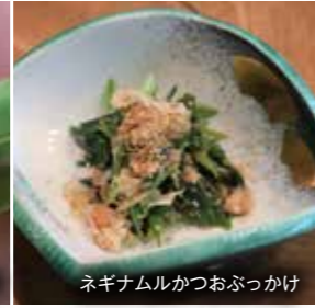
ネギナムルかつおぶっかけ