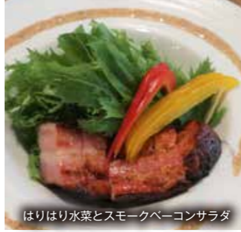
はりはり水菜とスモークベーコンサラダ