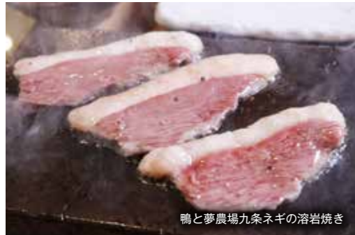
鴨と夢農場九条ネギの溶岩焼き