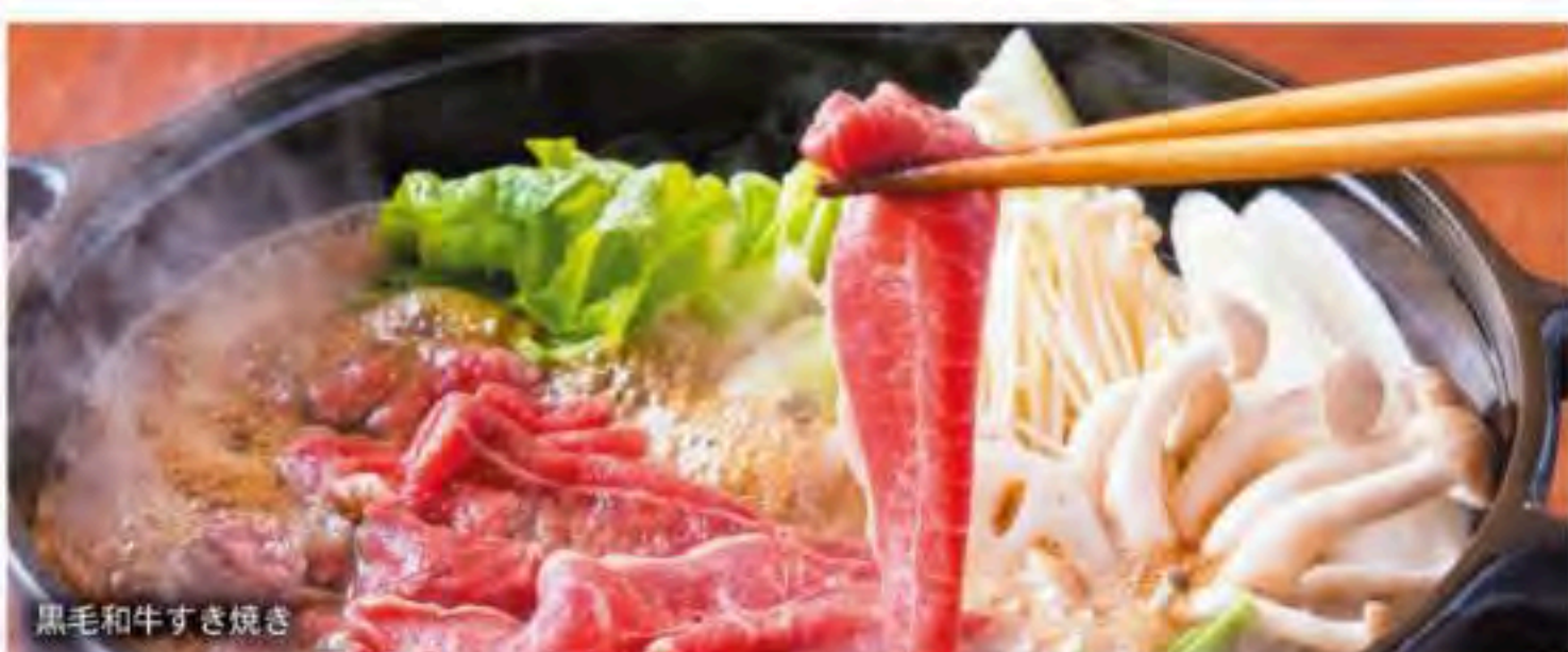
黒毛和牛すき焼き