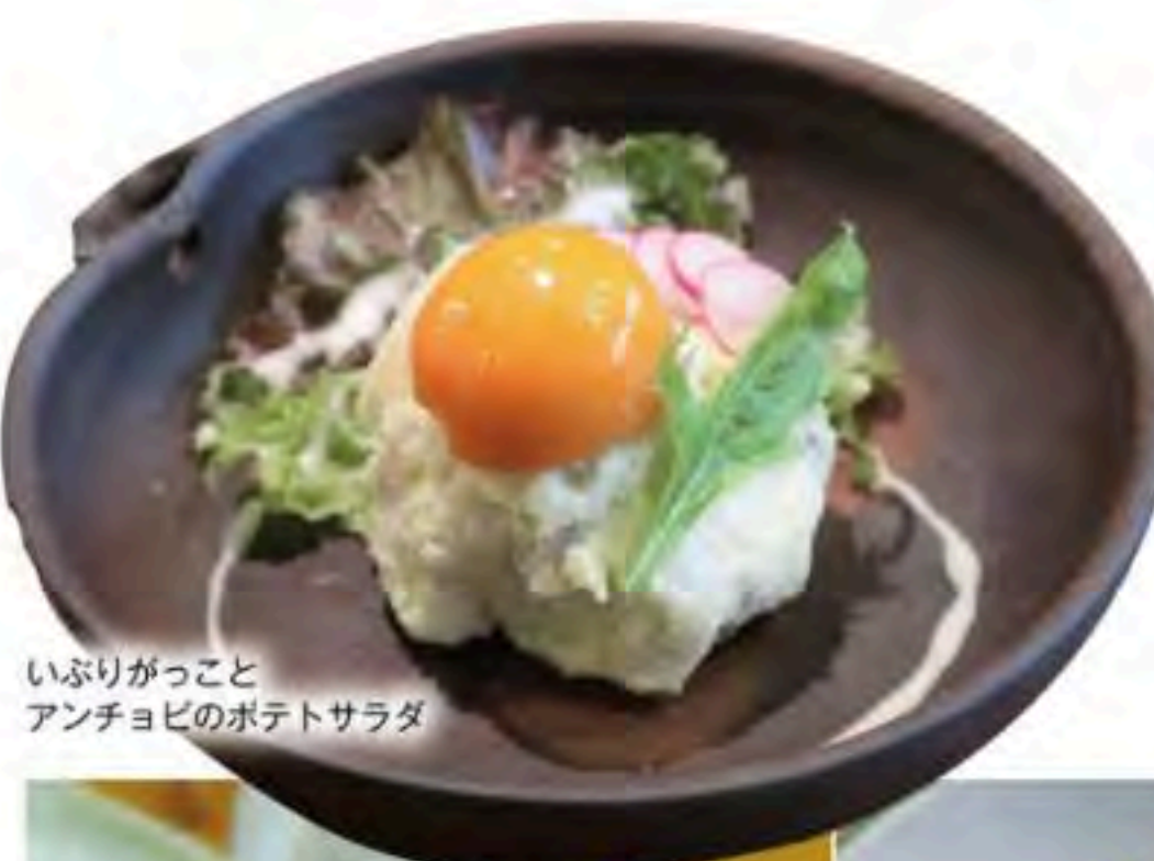
いぶりがっことアンチョビのポテトサラダ