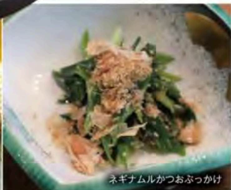
ネギナムルかつおぶっかけ