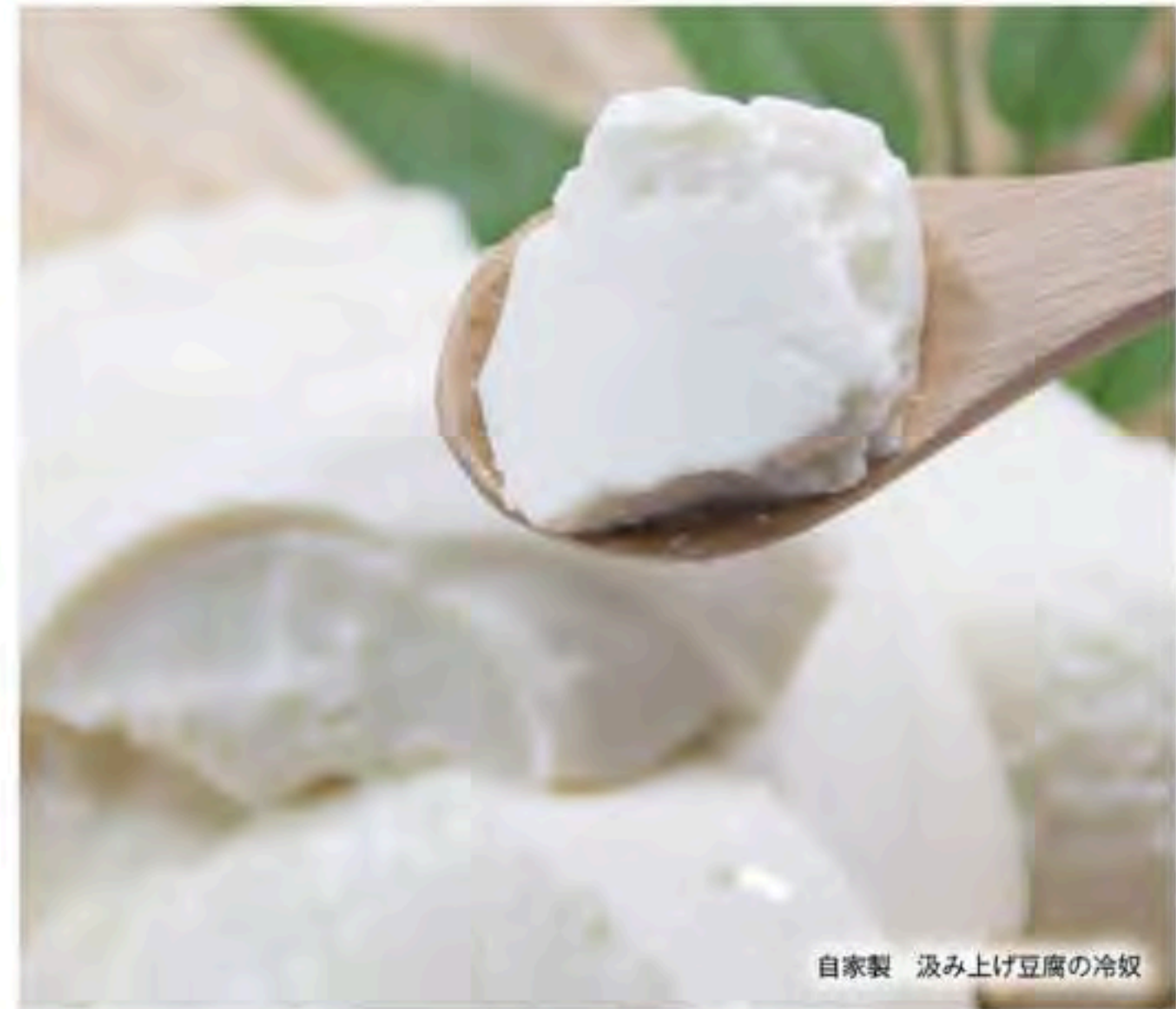
自家製 汲み上げ豆腐の冷奴