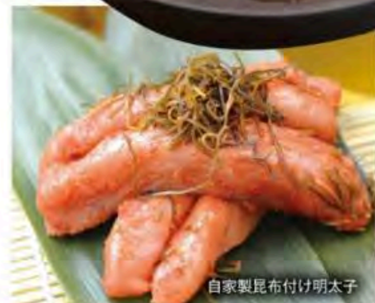
自家製昆布付け明太子